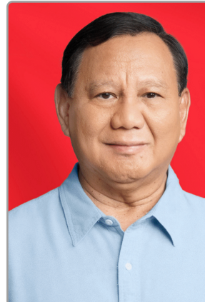
CALON PRESIDEN H. PRABOWO SUBIANTO