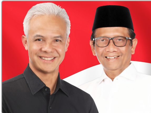
CALON PRESIDEN H. GANJAR PRANOWO, S.H., M.I.P. CALON WAKIL PRESIDEN Prof. Dr. H. M. MAHFUD MD