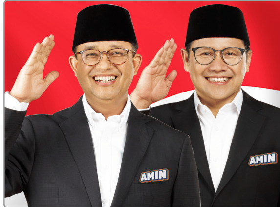
CALON PRESIDEN H. ANIES RASYID BASWEDAN, Ph.D