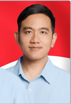
CALON WAKIL PRESIDEN GIBRAN RAKABUMING RAKA