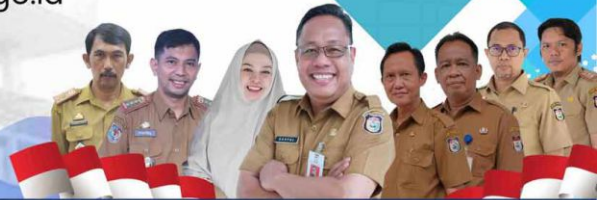
PIMPINAN SEKRETARIAT DPRD KOTA MAKASSAR