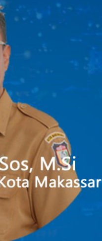
Sos, M.Si Kota Makassar